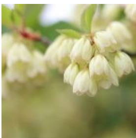
シロバナフウリンツツジ