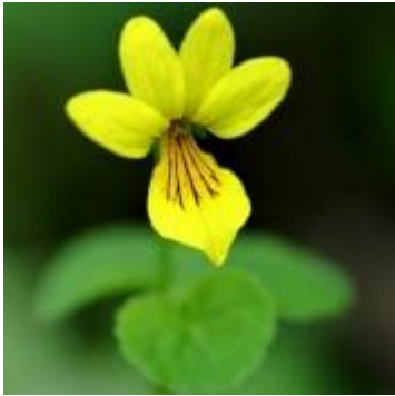
キバナノコマノツメ