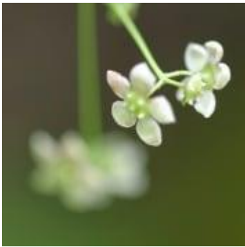
イワセントウソウ