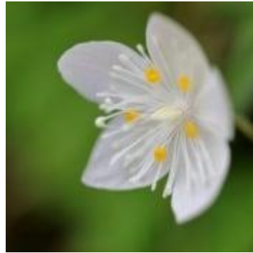
ツルシロカネソウ