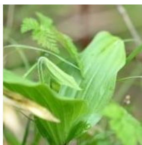
キバナノアツモリソウ